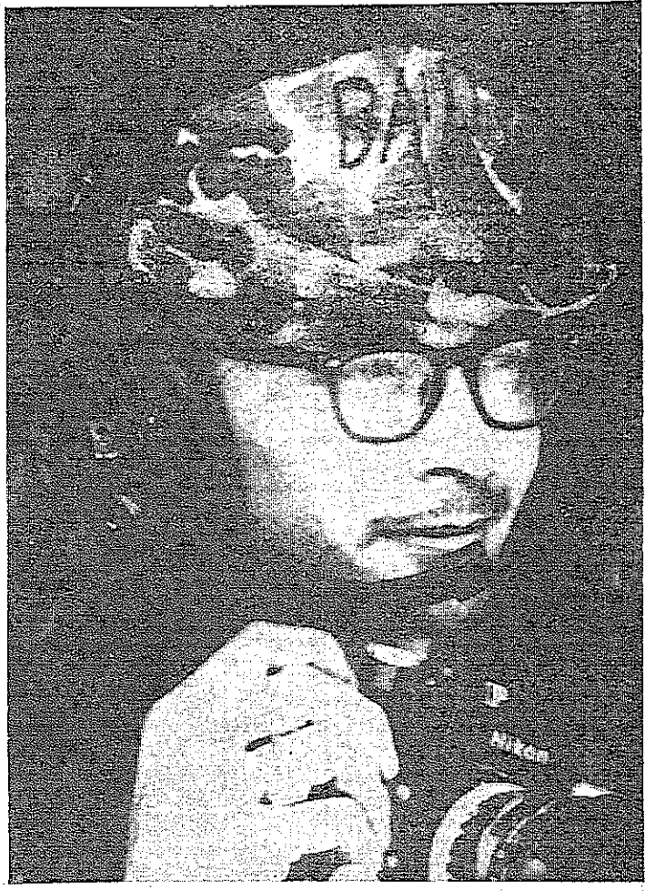
مصور اليونانيديس تشارلس جيلستون (في صورة من الارشيف عام ١٩٦٧ حين أعلن بطلا للاسطول الأمريكي في حرب فيتنام « وقد قتل يوم الاثنين الماضي بينما كان يغني اخبار الحرب في سايفون - وتشارلس في الثالثة والعشرين من عمره وقد وصل الى فييتنام قبل اربع سنوات ضمن الاسطول الأمريكي وانضم الى هيئة مستخدمين اليونانيديس عند تسريحه من خدمة الاسطول في تشرين الاول - التالي »